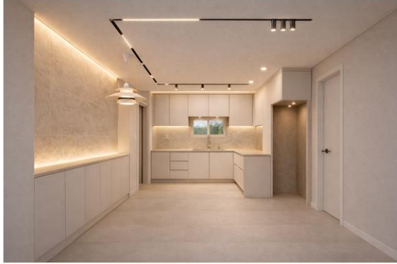
B안 · 라이트 베이지 따뜻하고 실거주 감성