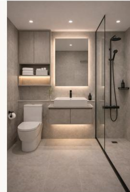
B안 · 웜 그레이 도시적이고 세련된 느낌

욕실은 세로 비율이 중요하므로 비교 보드에서는 전체 구도가 보이도록 별도 확대 정리했습니다.