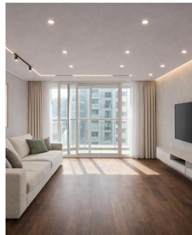
B안 · 다크 월넛 고급스럽고 묵직한 타입