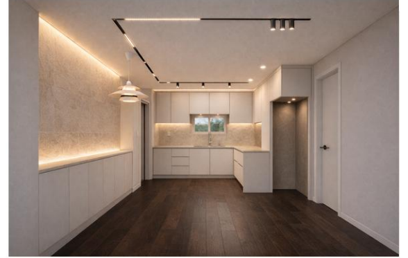
C안 · 다크 우드 강한 포인트와 대비감