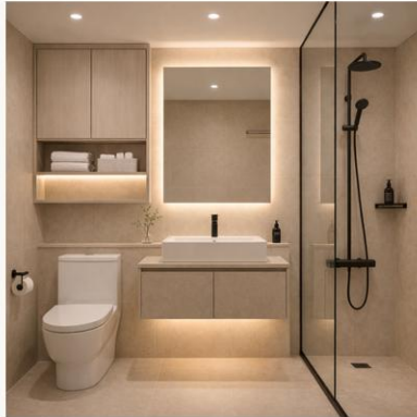
A안 · 웜 베이지 따뜻한 호텔형, 안정감