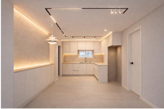
A안 · 베이지 타일 공간이 넓고 부드럽게 보임