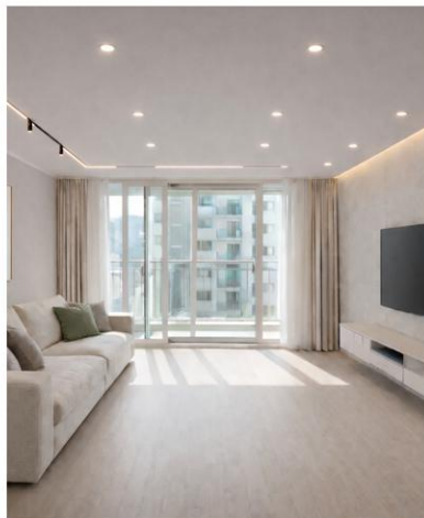
A안 · 라이트 우드 가장 대중적이고 밝은 타입