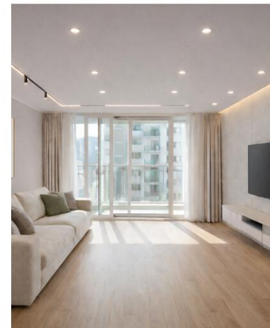
C안 · 뉴트럴 오크 밝음과 고급감의 중간